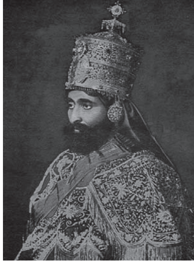
صاحب الجلالة الإثيوبية هيلاسيلاسي الأول إمبراطور الحبشة.