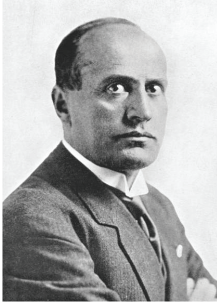
سنيور بنيتو موسولينى زعيم إيطاليا ومحرك الحرب الحبشية الإيطالية.

كانت إشارة من هذا الرجل تكفي لقلب الوزارة، وقد أوضح أحد الكُتَّاب مقدار تأثير ذلك الوزير في الكلمات الآتية: «إنا مدينون لموسيو فلان وحده بكوننا اشترينا التونكين بثلاثة أضعاف ما تساويه، وبكوننا لم نضع في مدغشقر إلا قدمًا متزعزعة، وبكوننا غلبنا في مملكة كاملة جنوب نهر النيجر، وبكوننا أضعنا ما كان لنا من النفوذ الخاص في الديار المصرية. ألا إن نظريات موسيو (فلان) قد كلفتنا من الخسائر أكثر من مصائب نابليون الأول!»