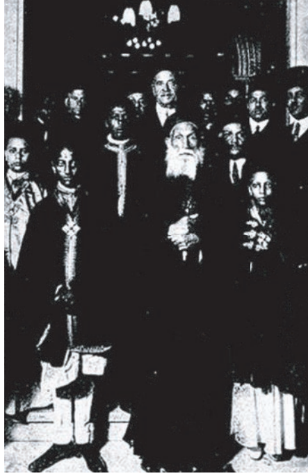
صاحب الغبطة الأنبا يونس بطريرك الأقباط وحوله بعض المطارنة والأعيان.

ولو كانت لمصر شخصية محترمة في جنيف؛ لكان للقاهرة أرفع مقام في النزاع الحالي، وكانت تصبح مصر عاصمة دولية تتجه إليها الأنظار، وتشد إليها الرحال، وتجتمع لديها كلمة الرجال، وتمسي مفتاح الشرق الأدنى بلا جدل. ولا ريب عندنا في أنه لو كان لمصر هذا الحق لوقفت بجانب مبادئ العصبية، دون أن تنظر إلى كونها متفكرة وسياسة إنجلترا أو إيطاليا أو غيرها أم لا؛ لأن مبادئ العصبية تضمن الحياة والحرية للأمم الصغيرة والأمم المغلوبة، والأمم التي تطلب الحرية، والأمم التي تقاوم الحرب، وقد انضمت إلى مبادئ هذه السياسة جهازًا حكومات عظمى، مثل: الولايات المتحدة، وفرنسا، وروسيا.