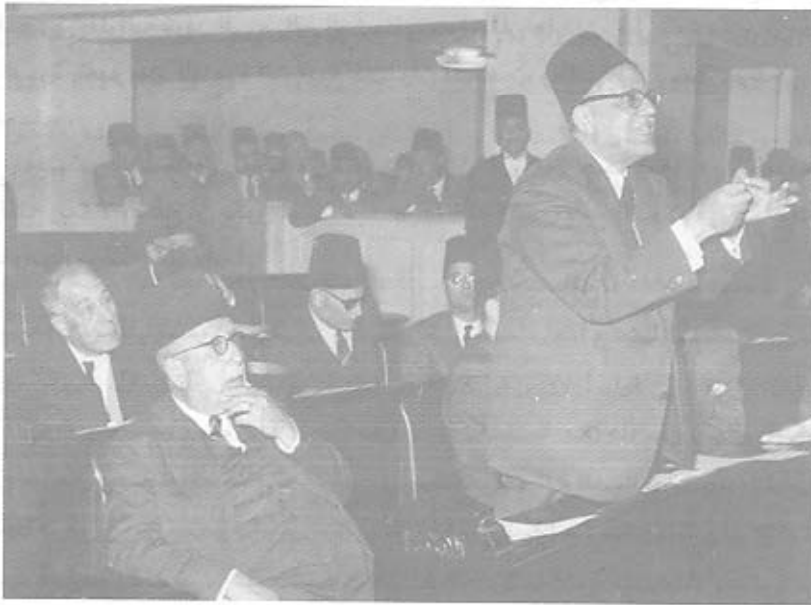
اجتماع لجنة الدستور وفي الصورة مكرم عبيد

لجنة إعداد الدستور وشكلت بمرسوم في ١٣ يناير ١٩٥٢.