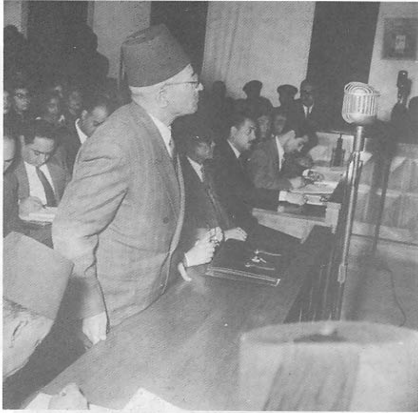
حسن الهضيبي أثناء المحاكمة