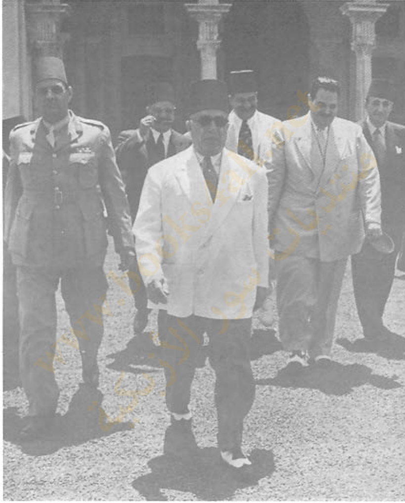
حسين سرى باشا و حيدر باشا و فؤاد سراج الدين