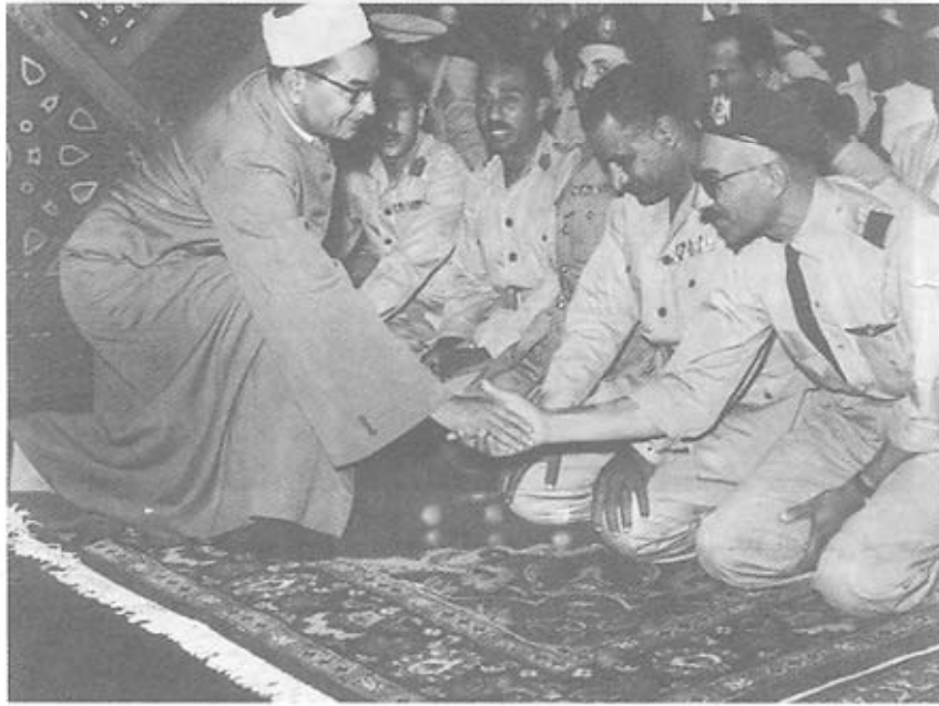
جمعت صلاة العيد رجال الثورة و افراد الشعب في ميدان الجمهورية ويرى الشيخ الباقورى وهو يسلم على رجال الثورة

أهم وزراء الثورة الذين لعبوا أدوارا حاسمة في توجيه القرارات السياسية التي صدرت عن مجلس قيادة الثورة .