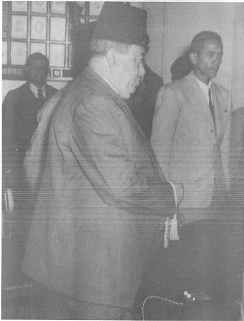
عبد الرازق السنهوري باشا