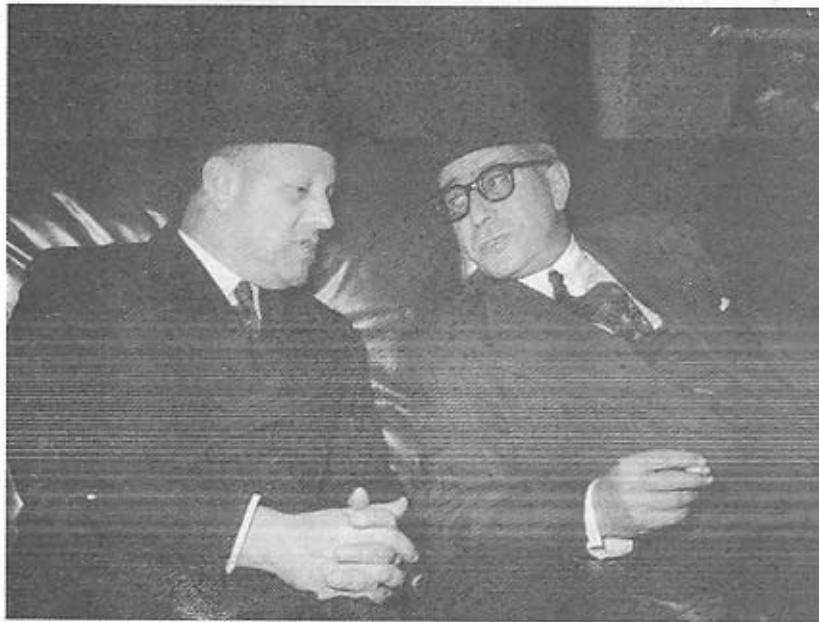
محمد حسين هيكل باشا وعبد الخالق حسونه