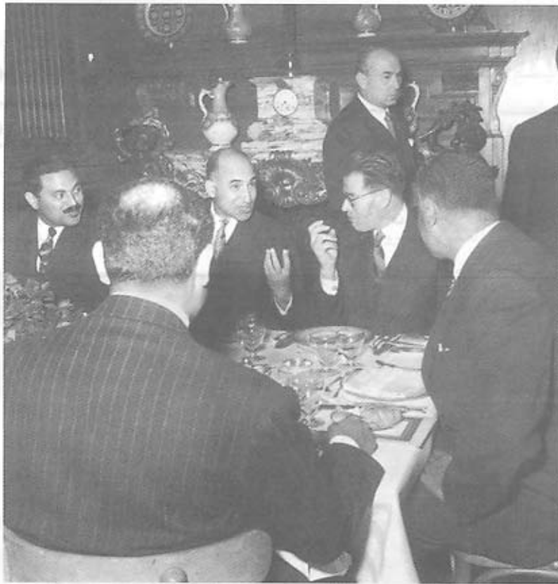
د. محمود فوزي وجمال عبد الناصر وحسين الشافعي في حفلة توديع السفير الروسي في مصر

والتي استقبلت في ١٩٥٤ في القاهرة والتي كانت في ذلك الوقت