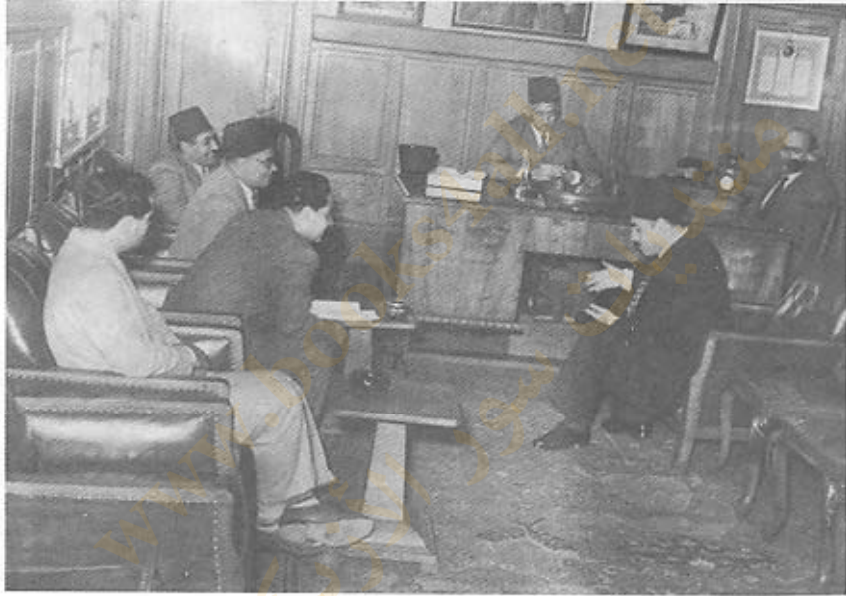
أحمد حسين زعيم الحزب الاشتراكي يشرح لأعضاء اللجنة التي ضمت جميع الأحزاب والهيئات المصرية لتنظيم مظاهرة ١٤ نوفمبر وقد تصدر الاجتماع صالح حرب باشا