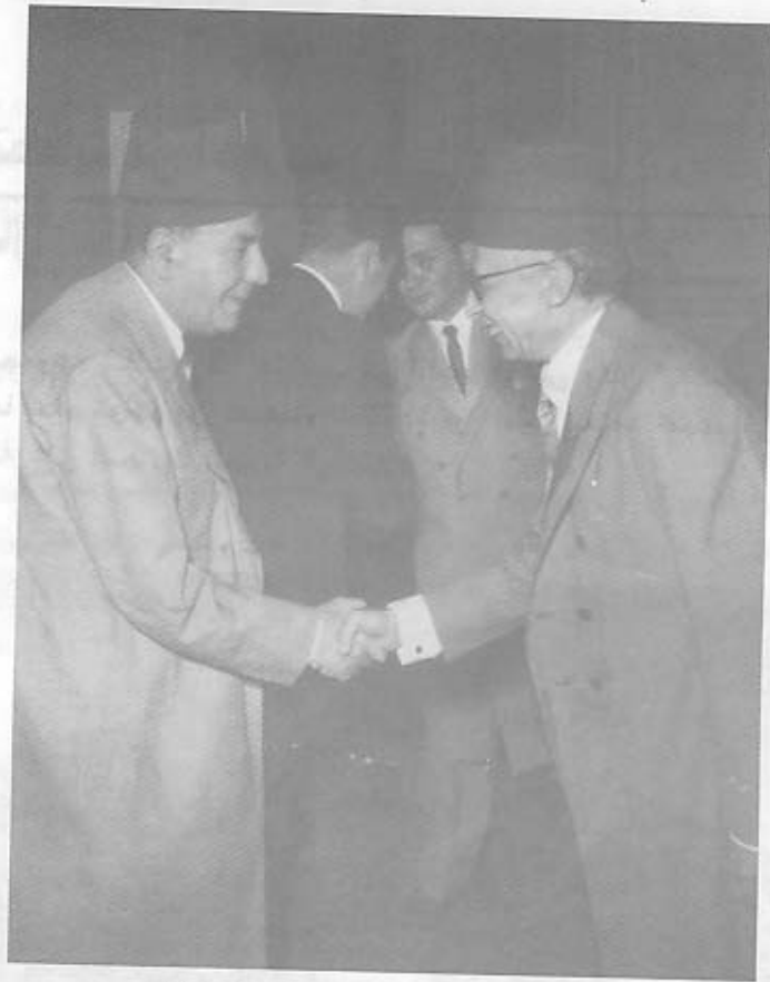
حافظ عفيفى باشا - نجيب الهملاى باشا

يذكر بعض من المشاهير الذين شاركوا في مؤتمر القاهرة في سنة ١٩٥٦