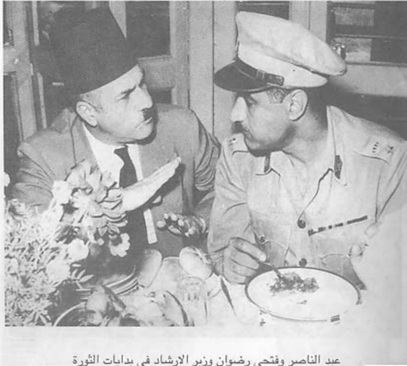
عبد الناصر وفتحى رضوان وزير الارشاد فى بدايات الثورة