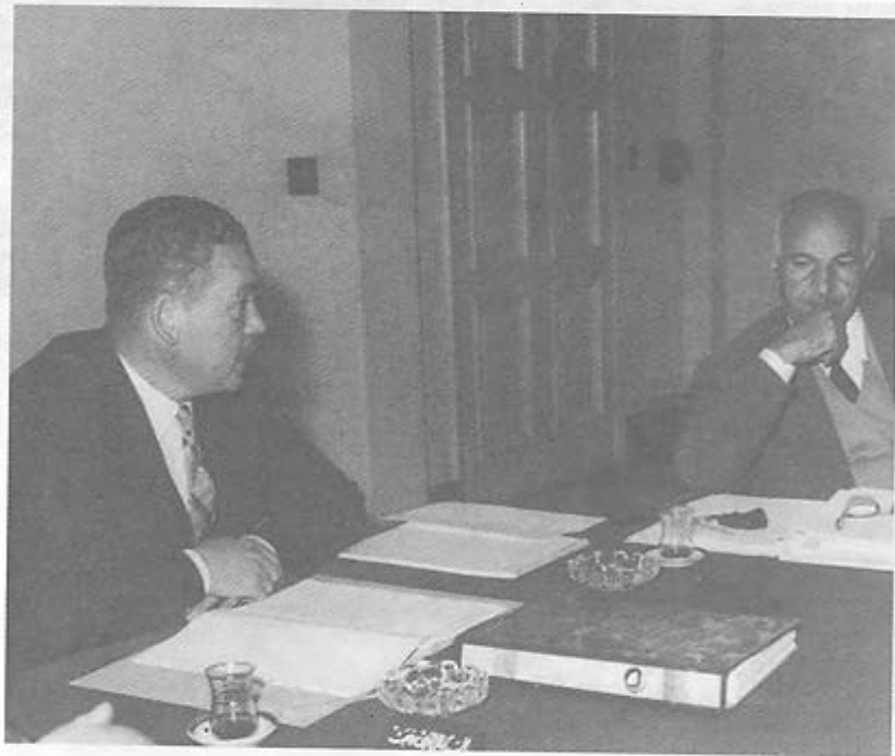
اجتماع اللجنة العليا للإتحاد الاشتراكي حسين الشافعي يتحدث ونور الدين طراف ينصت

واحد من أعضاء اللجنة العليا للإتحاد الاشتراكي حسين الشافعي يتحدث مع نور الدين طراف