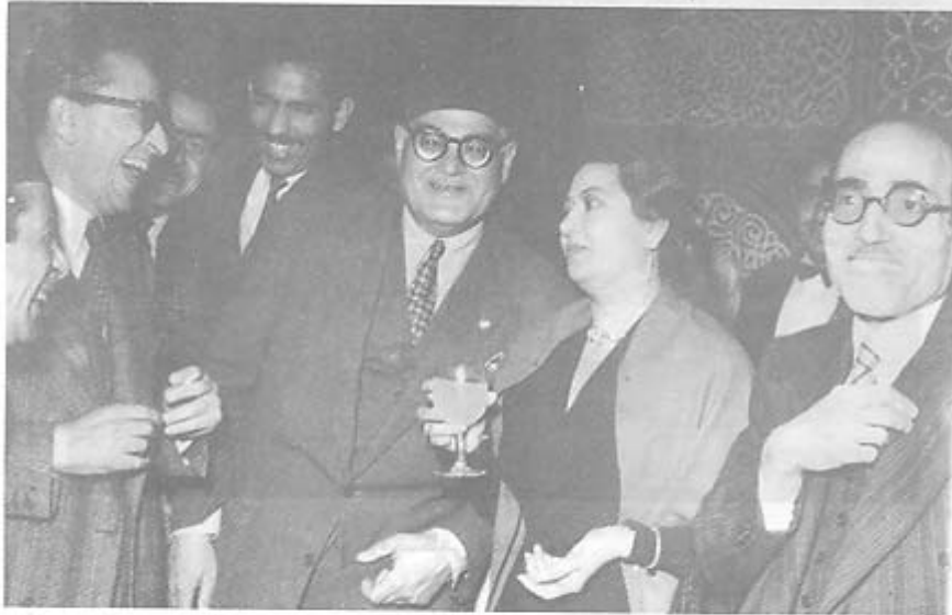
فكرى اباضه مع أم كلثوم ومحمد القصبجي واميل زيدان

تراجم للصحفيين البارزين الذين كان لهم دورا هام في تشكيل الرأي العام في مطلع الخمسينات .