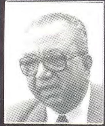
د. رءوف عباس

تفتقر المكتبة العربية إلى الكتب التي تقدم سيرة حياة الشخصيات العامة التي لعبت دوراً بارزاً في الحياة المصرية العامة بمختلف أبعادها، ولكن هذا الكاتب ينفرد بتقديمه بعض الشخصيات السياسية المصرية من خلال تراجم أعدتها عنهم السفارة الأمريكية بالقاهرة فيما بين ١٩٥١-١٩٥٣ ، وهي السنوات التي شهدت ذروة الأزمة السياسية والاجتماعية التي أطلقت ثورة يوليو ١٩٥٢ . ومصدر هذه المجموعة من التراجم الأرشيف الوطني الأمريكي (وثائق وزارة الخارجية الأمريكية) ، قام بترجمتها وتصنيفها وتحليلها د. رءوف عباس أستاذ التاريخ الحديث بجامعة القاهرة. وتتضمن هذه التراجم معلومات مهمة تتصل بتاريخ مصر المعاصر في مرحلة تحول مهمة، لازالت في حاجة إلى إلقاء المزيد من الضوء عليها.