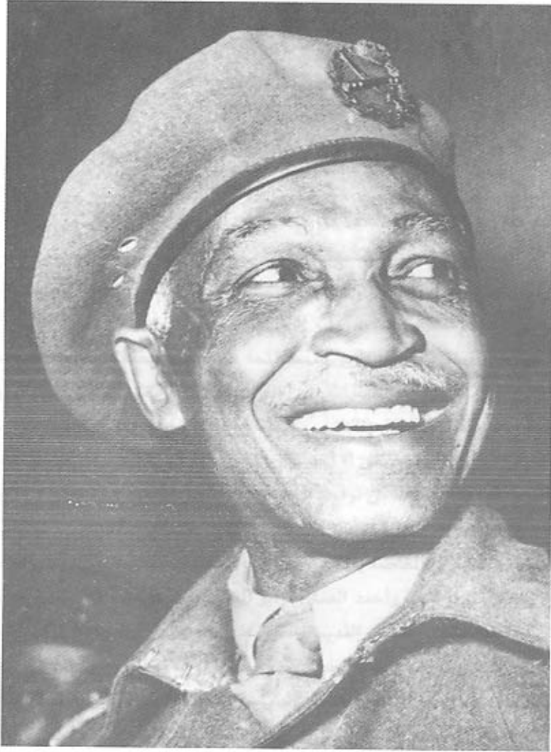
اللواء أحمد فؤاد صادق