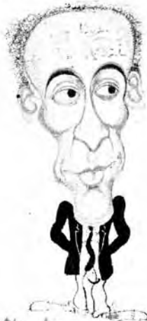
الرفق على السام

حسين عبد النبي ، فهو فنان وحساس ثم هو مضحك أيضا • ولكنه سيضيع بسبب حسة عقله ، ولانه أهوج ، ولانه مستعجل شهرة ، وجامع شيكات من جميع الفرق ومن كل برامج الاذاعة والتليفزيون • ولانه يضع رأسه برأس عبد المنعم مدبولي • وهو يريد أن يثبت أنه أعظم من مدبولي وأرسخ • ولكنه لن يستطيع أن يثبت ذلك بسبب حسته ولهوجته واستعجاله • ولانه لم يستخدم رأسه في التفكير أو في البحث لنفسه عن لون يميزه أو هدف يسعى اليه • ويستطيع سيد راضي أن يتخلص من قيوده لو ركز نفسه في شيء ما • في الاخراج مثلا ، فهو مخرج يستطيع أن يقدم الكثير • وأنصح بالتخلي عن التأليف والاقتباس ، فهو ليس مؤلفا ولن يكون • على أن نقطة الضعف فيه كمخرج انه لا يفهم النص المكتوب ولا يستطيع أن يستخرج منه ابعادا أخرى أو اسقاطات معينة • لان عقله مثل حياته مسطح ومفلطح ، ولكنه رغم ذلك لاتزال امامه فرصة لو أحسن استغلالها فسيصبح سيد راضي واحدا من المضحكين الصوريين •