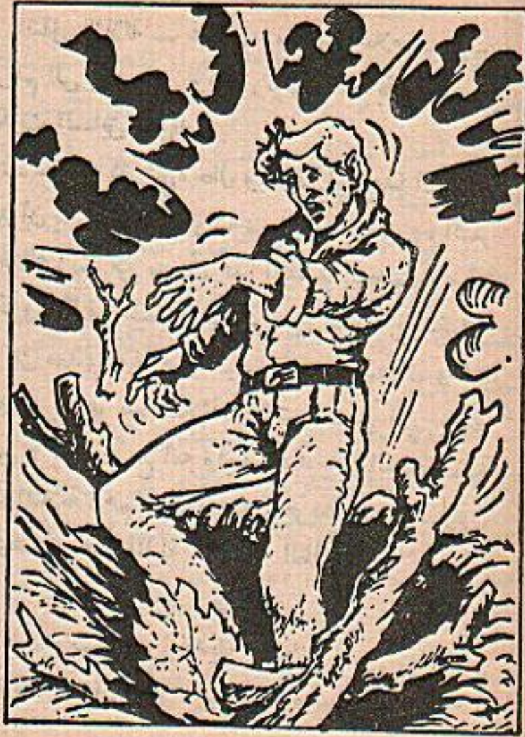
ما ان تحرك خطوتين حتى سقط في العفرة .

من حقنا أن تصرف بهذا الشقي .. أجاب الثاني :