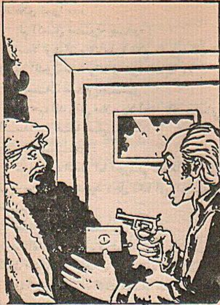
ارتبك المجرم واخرج مسدسه بسرعة البرق .

بعد أقل من دقيقة واحدة ، يطرق عيدان الباب ، ولابد انه سيطرق الباب وينتظر عند السور ، وأیضا لابد ان أحدهم سواء الاب أو الام أو الصبي نفسه سيذهب ليرى من يكون القادم .. عندها .. سكت مهدي وحدق في عيون صاحبه وقال : - عندها أمسك بخناق الباقيين وأهددهم بخنجري وحال رجوع من ذهب منهم يدخل عيدان خلفه مباشرة ثم نطوقهم جميعا ونأخذ التسبي معنا ..