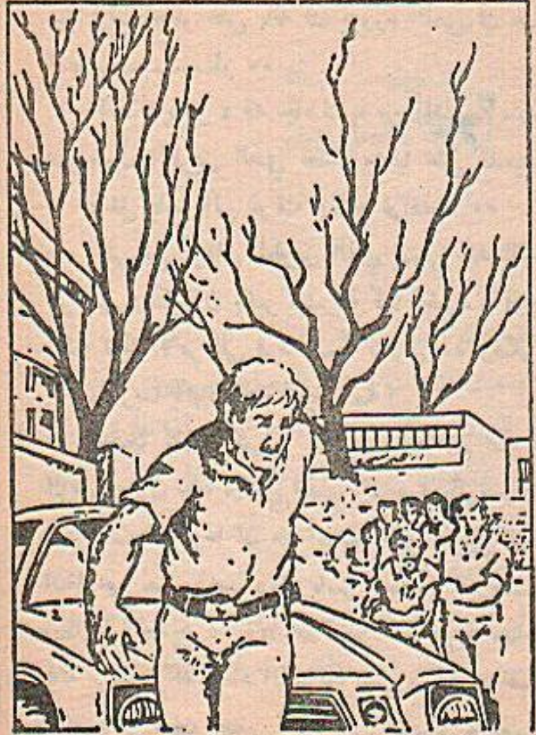
استكوه انه معهم .