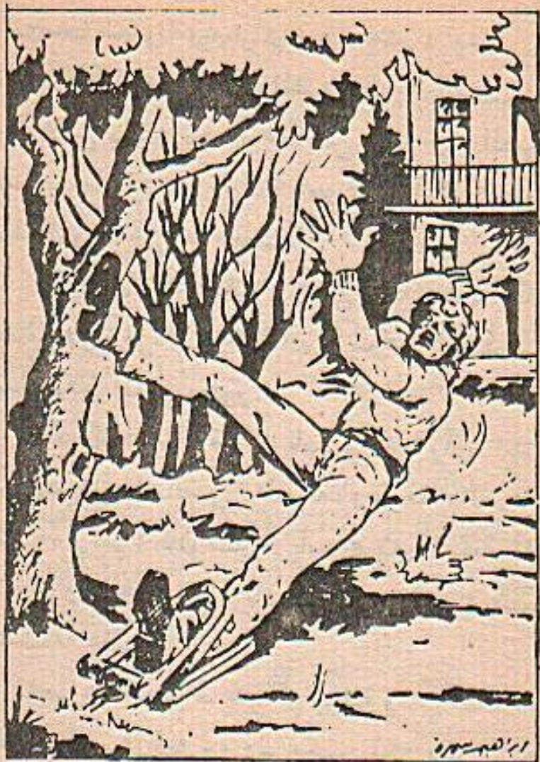
راح يصرخ مثل كلب مسعور

فقد راح يصرخ مثل كلب مسعور، بعد أن وقع ضحية مصيدة الفئران التي كبست على قدمه اليسرى ودخلت مساميرها في داخل اللحم وسال منها دم غزير جعل آلام « غلام » أكبر من قدرته على الصبر !