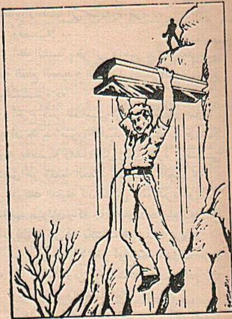
وما ان مد يده صوب التليذ حتى انسحب بخفة وهدوء .

لكنه لم يعثر على قطعة تسعفه وتنقذ هذا الصبي الذي ازداد خوفه عند أسفل الجبل .. عندها نظر « ياسر » الى المكان الذي هوى فيه التليذ ورأى بعض « سكراب » السيارات العتيقة .. فصرخ بأعلى صوته :