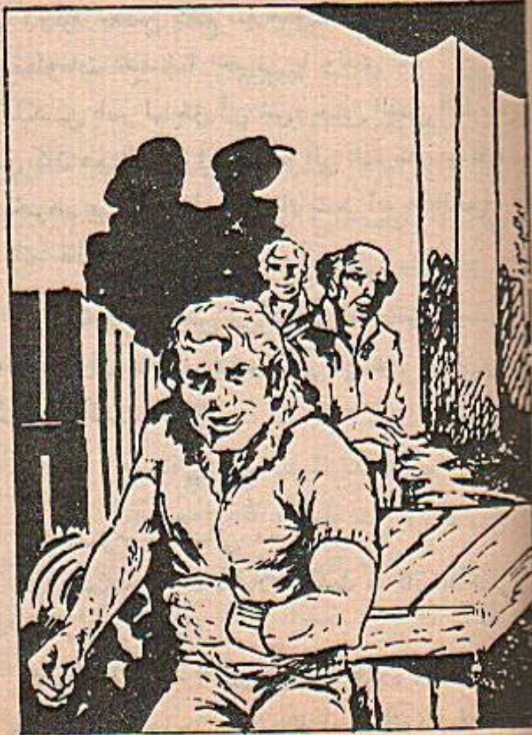
كانوا ثلاثة رجال نابط كل واحد منهم خنجرا .

الى فراشه ونام هانئا حتى الصباح .. في الصباح قال له ابوه : - ذهب اليوم الاول يا بني ، هل ما زلت تعتقد بانهم سيأتون الى دارنا ؟ قالت أم ياسر : - أنا أعرف ابني ، انه يعيش في الاوهام منذ طفولته ، وهو عنيد في رأيه على طول الخط .. ضحك ياسر وقال بهدوء : - لا أريد سوى ثلاثة أيام وقد راح الاول منها .. لن نخسر شيئا اذا كنا في امان .. قال الاب : - اشعر بانك تخفي علينا أسرارك يا بني .. قال ياسر بسرعة : - أسرارى ؟ واستمر الاب قائلا : - لماذا جاء اللصوص الى البيت ولم يسرقوا اى