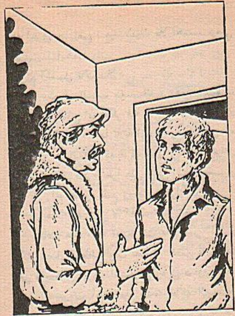
ماذا تنتظر حتى نغير الشرطة .