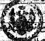
الورقة الاولى من مخطوطة لنينجراد = لن

بالإسراع عن غير ما يصح من بولي بصورة من غير ما طرد من التواضع في ايراد ما ورد وانما ثبت الا ان الله انما طرد على المارد وروح الدخول تحت حكمه على اوسع له ولا يقيد في حقيقته ما يتصايبه والذات الخفية بجمل ان قد اراد حقه في حقه انما يحكم المقدمان والذات غير ما شره على مباح والذات بسبب حقيقته في الامم والذات في المزارر من حقيقته في حقيقته من حقيقته حقيقته حقيقته حقيقته في حقيقته حقيقته والذات في حقيقته حقيقته حقيقته حقيقته حقيقته حقيقته حقيقته حقيقته حقيقته حقيقته حقيقته حقيقته حقيقته حقيقته حقيقته حقيقته حقيقته حقيقته حقيقته