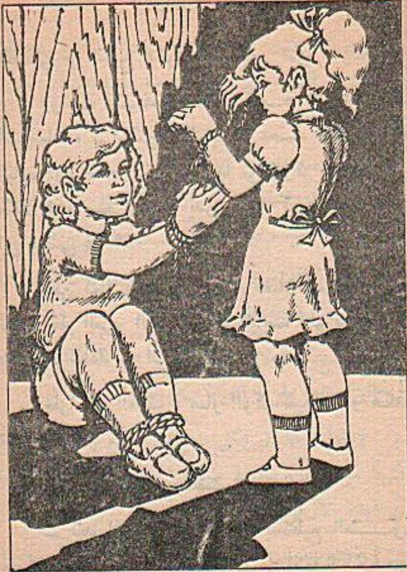
ثم أخذت تقطع الحبل الغليظ الذي يلتف حول يديه