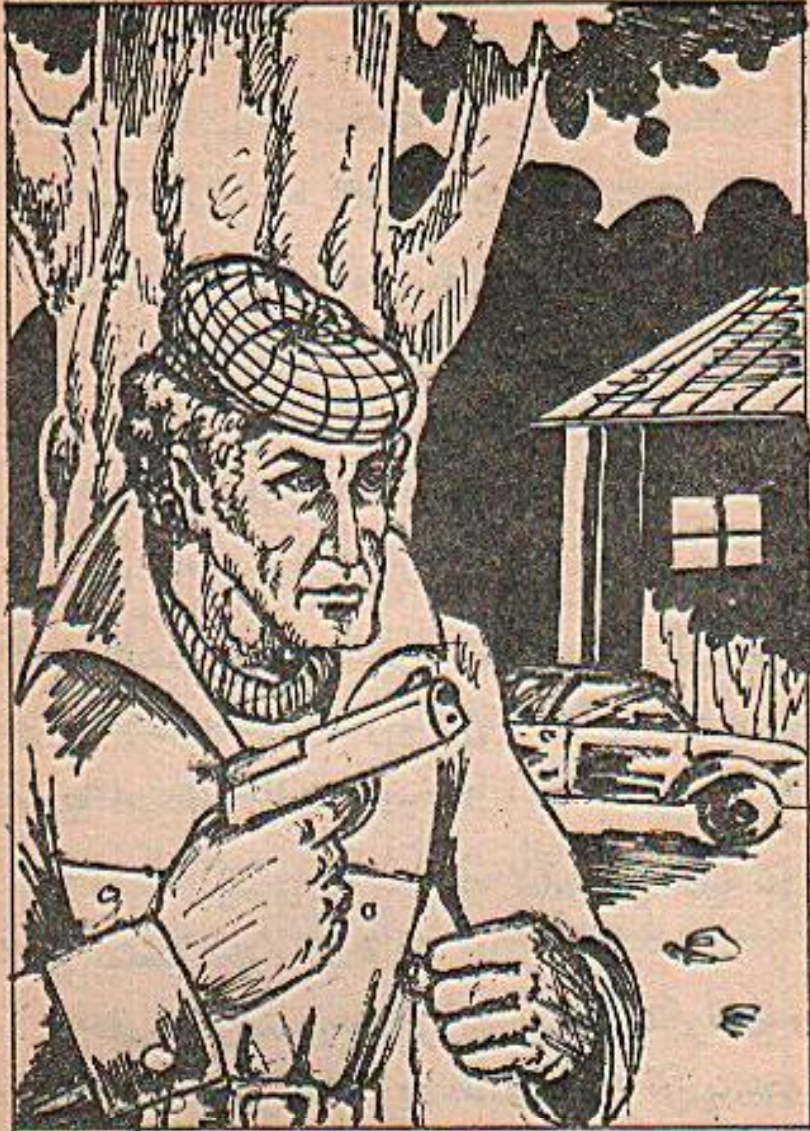
عندها شعر بنيامين ان شيئا غريبا قد جرى

عندها شعر بنيامين أن شيئا غريبا قد جرى في غيابه ، السيارة المملوطة بالطين ، وحبال مقطوعة تشبه تلك التي ربطوا بها سندس وكمال ، اضافة الى شيء مهم ، هو ان ( جون ) لم يستقبله عند الباب كما يفعل في كل مرة ..