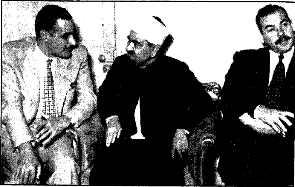
حسين الشافعي والشيخ محمد فرغل وجمال عبد الناصر