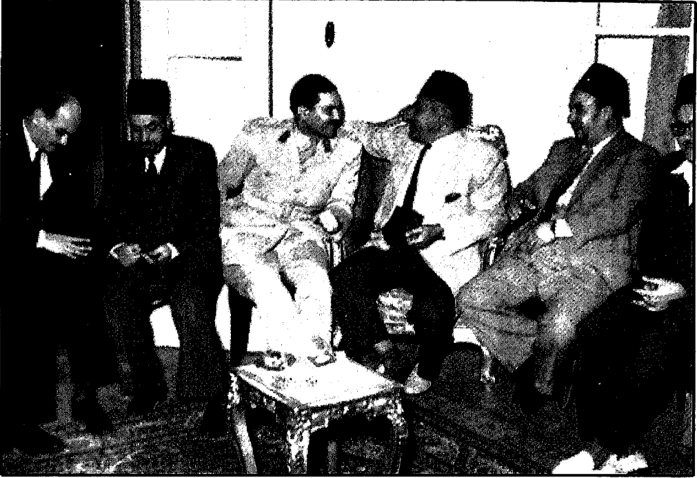
خميس حميدة وعبد الحكيم عابدين وكمال الدين حسين وعبد الرحمن البنا وصلاح سالم