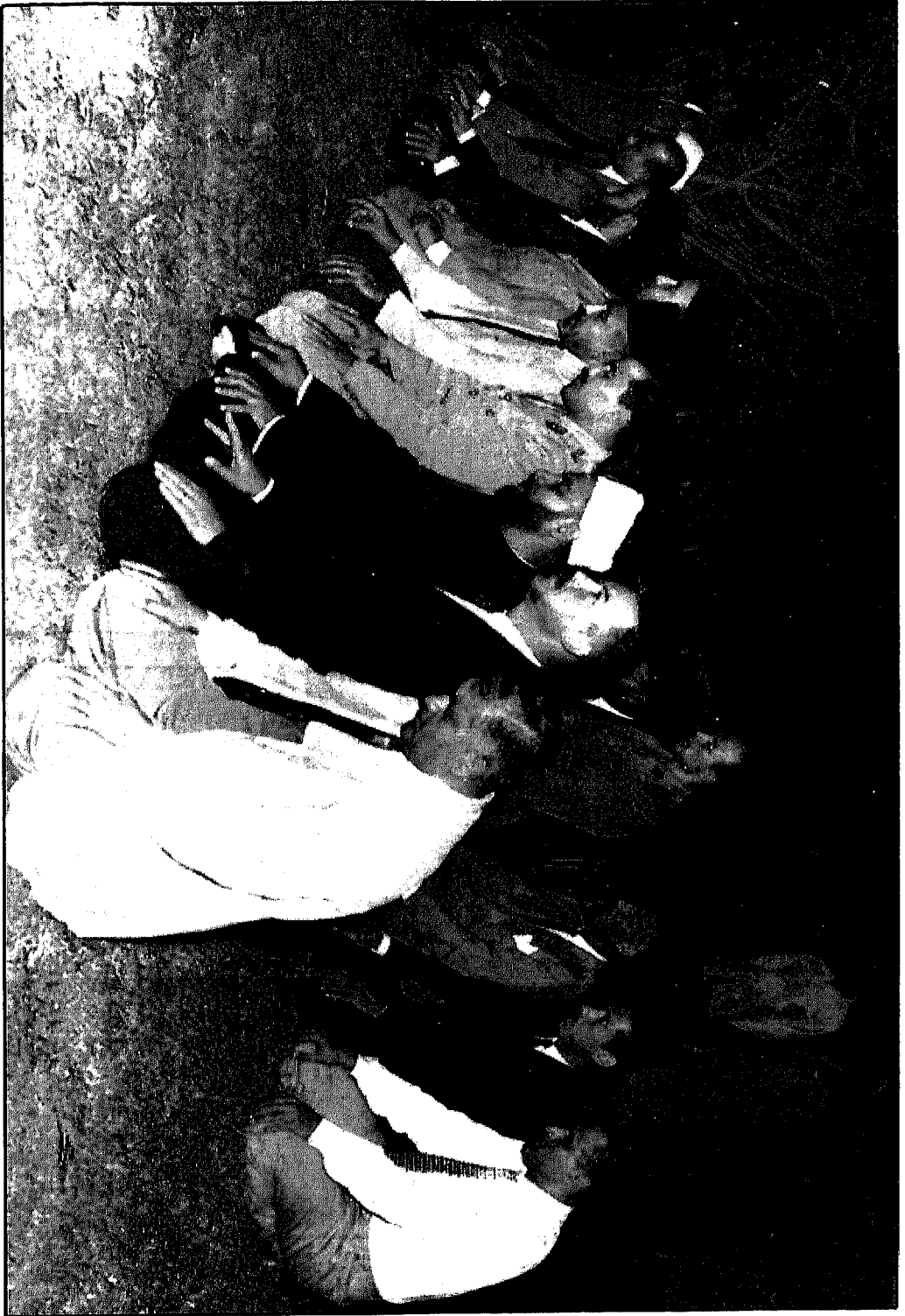
قيادات الثورة وقيادات الإخوان في صلاة الجماعة ، وبداية الناصر الأول في الصف الثاني