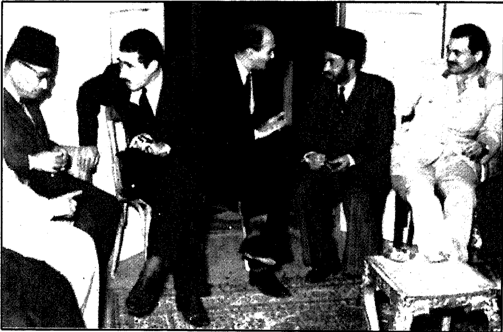
كمال الدين حسين وعبد الرحمن البنا وصالح سالم وعبد الحكيم عامر وعبد العزيز عطية