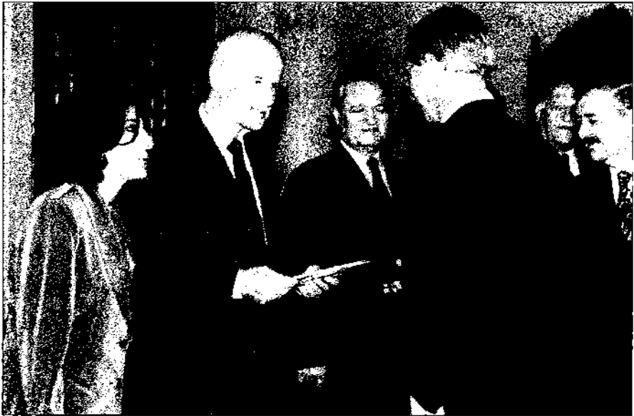
بثينة شعبان (إلى اليسار) مع الرئيس حافظ الأسد ووزير الخارجية فاروق الشرع يستقبلون السفراء الأجانب في دمشق منتصف التسعينيات.

كبير الحجم الصورة: «مع أحرّ وأطيب تحياتي، بيل كليتون». أخذ الرئيس الأسد هذا التذكار الذي يعبر عن مشاعر طيبة من الرئيس كليتون، وهو يتسّم، ثم أعطاه لي. وقال روس: «سيدى الرئيس، أنتم لا تعرفون مدى صراحة الرئيس كليتون معكم» (ابتسم الرئيس مرة أخرى، وكان قد تحدّث هاتفياً مع كليتون قبل فترة قصيرة)، وتابع: «إنه لا يطيل الحديث على الهاتف مع أي شخص أبداً بقدر ما يطيله معكم». هكذا أضاف روس بلهجة تكاد تكون حارة (وأقول «تكاد تكون»، لأنه في الواقع من الصعب جداً رؤية روس يتحدث بحرارة عن أي موضوع).