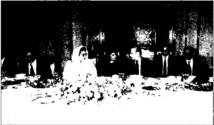
حفلة عشاء تكريماً لرئيسة الوزراء الباكستانية بنظير بوتو في دمشق في عام ١٩٩٦. من اليسار إلى اليمين: رئيس الوزراء محمود الزعبي، ورئيسة الوزراء بوتو، وبشينة شعبان، والرئيس حافظ الأسد، ومساعد وزير الخارجية عبد الفتاح حمورة، وآصف زرداري (زوج بوتو).

لم يرمش للرئيس الأسد جفن: «فليغادر إذا؛ الأمر متروك له!»، واستطعت أن أعرف من نظرة عينيه أنه لو كان قد فكر في إمكان اختصار اجتماعه مع بوتو كي يستقبل كريستوفر، فإن أسلوب لي الذراع الذي لجأ إليه الوزير الأمريكي قتل تلك الفكرة. وأرسل رئيس التشريعات رسالة إلى كريستوفر تقول إن الرئيس الأسد «لديه جدول مليء»، ولن يتمكن من استقبال رئيس الدبلوماسية الأمريكية اليوم. وبدا أن الرئيس لم يكن يركز آنثذ على كريستوفر، بل على آصف زرداري، زوج بوتو، الذي كان يجلس إلى جانبي. فمن أجل أن تبدأ المحادثات الرسمية، كان على زرداري (الذي شغل لاحقاً منصب رئيس الباكستان من ٩ أيلول/ سبتمبر ٢٠٠٨ وحتى ٨ أيلول/ سبتمبر ٢٠١٣) أن يغادر الغرفة، إذ لم يكن لديه سبب رسمي لحضور اجتماع القمة بين زوجته والرئيس الأسد. لكن يبدو أن زرداري لم يفهم الرسالة، ولذلك تابع الرئيس الاجتماع في حضوره.