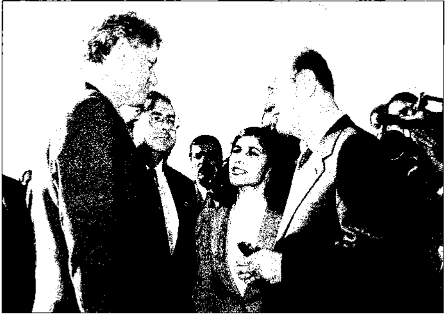
الرئيسان حافظ الأسد وبيبل كليتون، ومعهما بيثة شعبان، في مطار دمشق الدولي في تشرين الأول/أكتوبر ١٩٩٤.

على السلام مع الإسرائيليين في أي وقت من الأوقات. وقد رافقتُ الرئيس في زيارته الخارجية جميعها، وحضرتُ كل اجتماع عقده مع مسؤولين أمريكيين، من أعضاء في الكونغرس، إلى سياسيين من الوزن الثقيل، مثل جيمس بيكر وبيبل كليتون. ولم يقدم الأسد مثل هذا التعهد ولو مرة واحدة، حيث كان ذلك متناقضاً مع كل مبادئه ومواقفه التي لم تختلف في السر عنها في العلن أبداً.