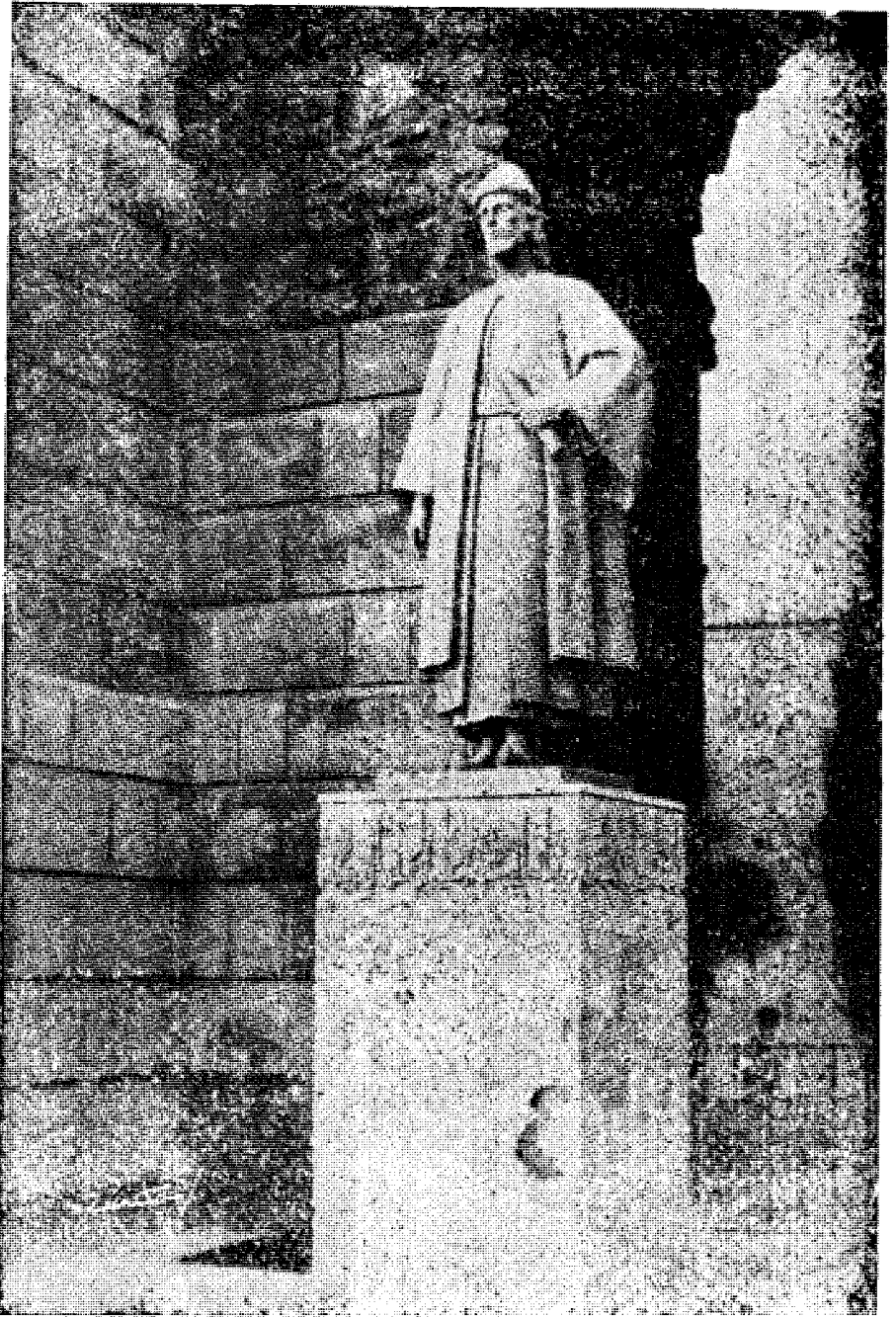
تمثال ابن خزم ، أقامته بلدية قرطبة عام ١٩٦٣م ، أمام باب أشبيلية ، أو العطارين ، وكان يودى إلى بلاط مغيث ، الحى الذى نشأ فيه ابن خزم ... من هنا كان طريقه اليومى إلى المسجد الجامع ، طالبها ، وأستاذا ، أو لصلاة !