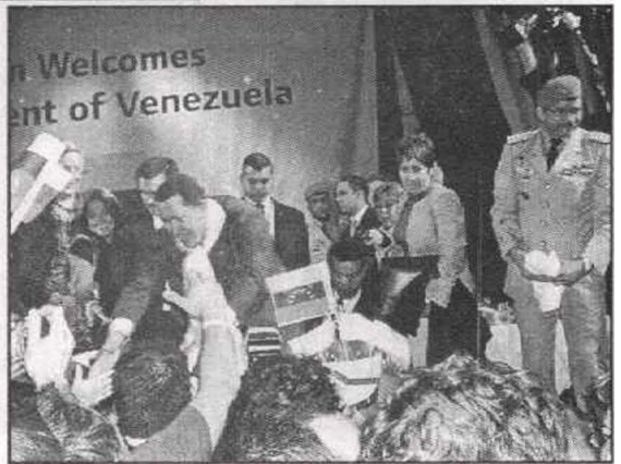
دائما ما يلاقى الترحيب في كل المؤتمرات