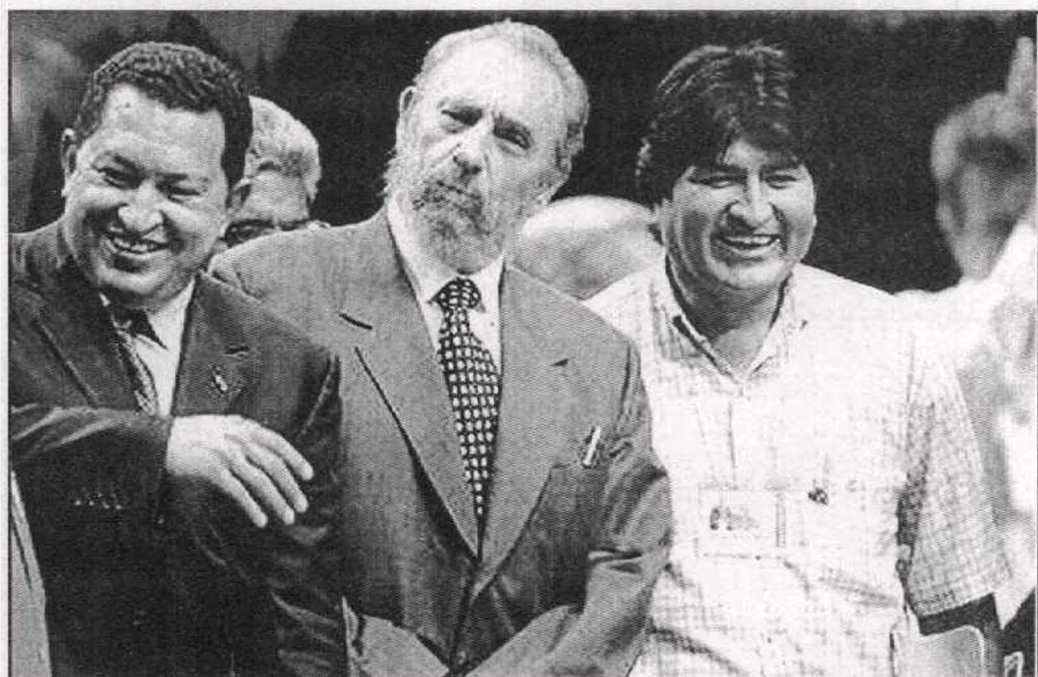
قنبلة الاشتراكية في الحديقة الخلفية لأميركا