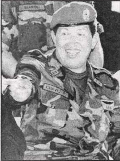
الجنرال المثقف الثوري