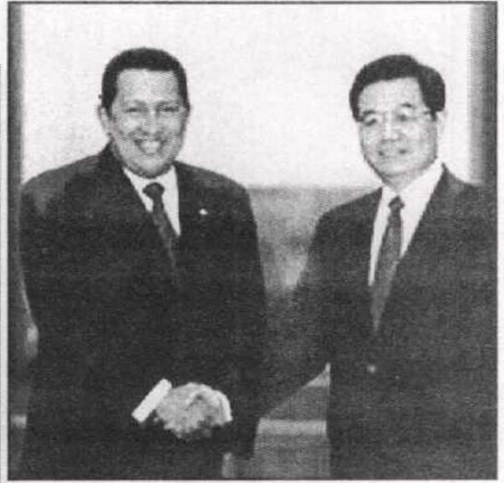
الرئيس الصيني هوجينتاو وعلاقة وطيدة بشافيز