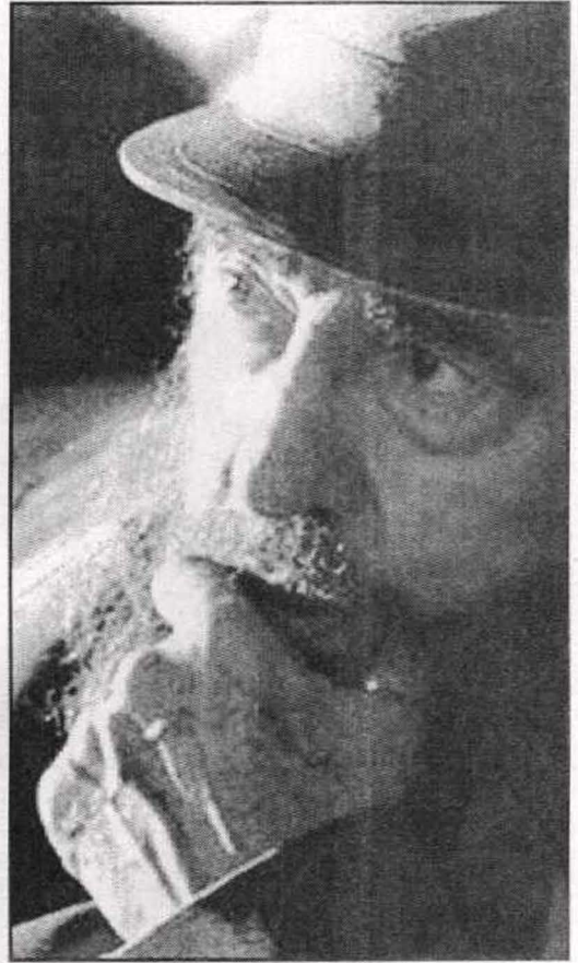
الزعيم الكوبي فيدل كاسترو رائد الحركة الراديكالية اللاتينية