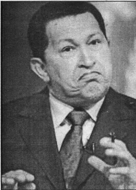
يمتعض من الصلف الأميركي