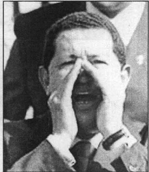
صرخة ملهوية.. شافيز يحشد أنصاره