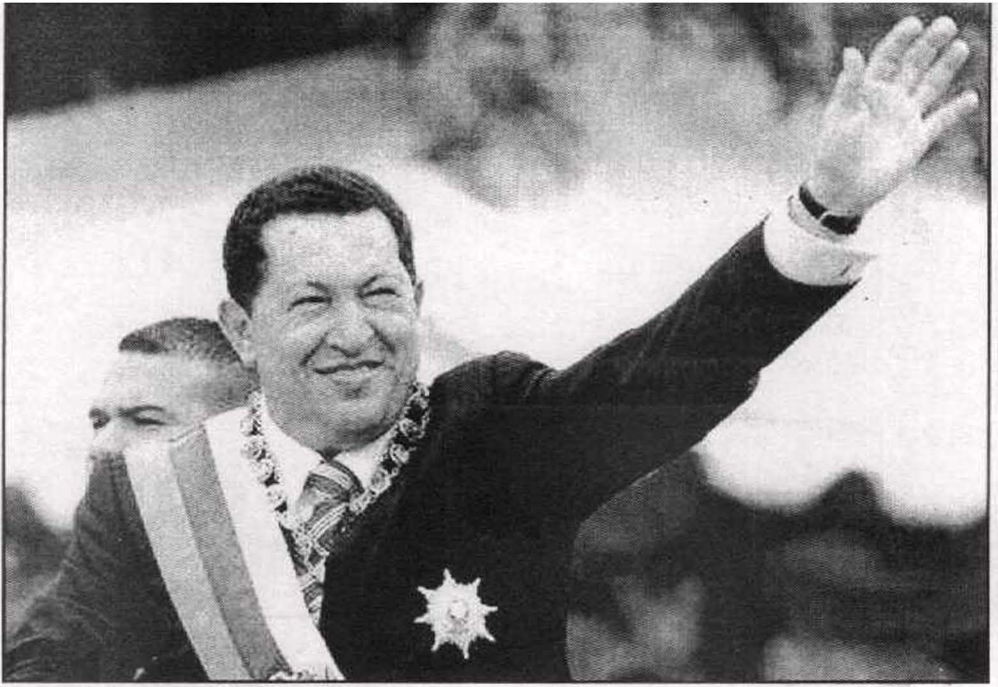
شافيز يحتفل بإعادة انتخابه رئيسا لـ فنزويلا