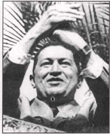
شافيز ودعوة للتلاحم