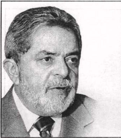
الرئيس البرازيلي لويس لولا دا سيلفا.. من الفقر الى قصر الرئاسة