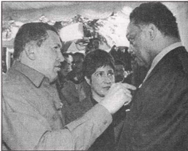
شافيز يقلد القس الأميركي جاكسون وساما