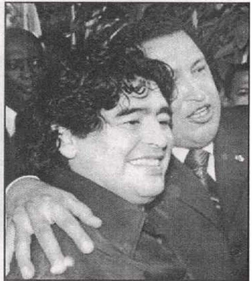
شافيز ومارادونا.. قائد يعرف قلب النجوم ولسانهم