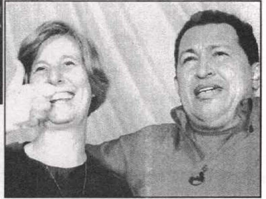
إحدى مناصرات شافيز في العالم العربي