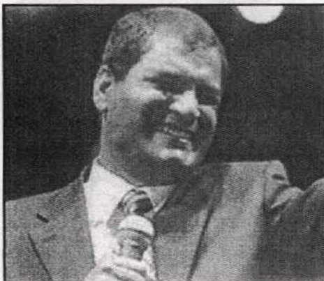
الرئيس الاقوادوري رفايل كوريا وجه ثوري جديد