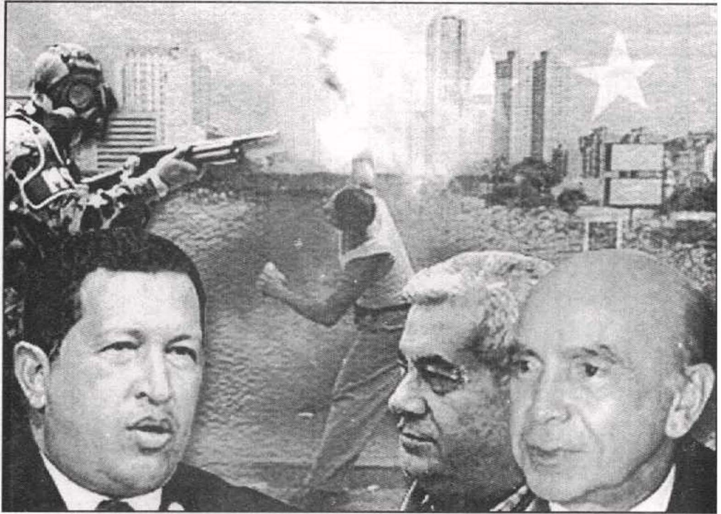
صراع شافيز مع رموز الإقطاع