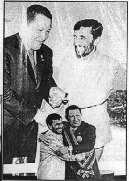
عناق حار يجسد التقارب الإيراني الفنزويلي