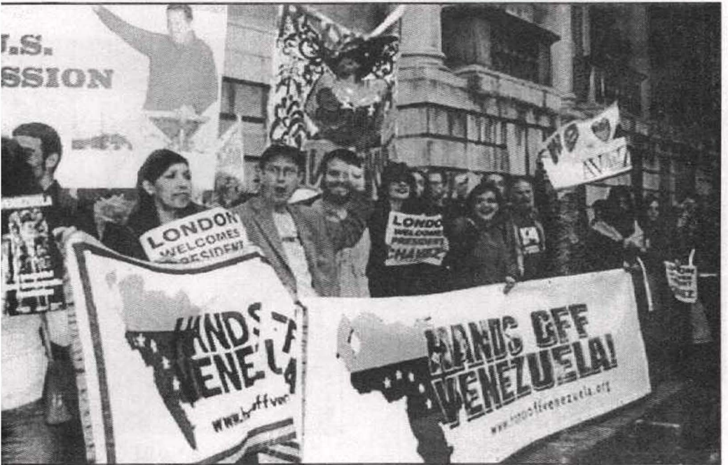
تظاهرات حاشدة بتأييد شافيز