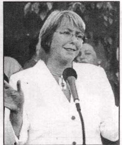
ميشيل باشيليت .. امرأة شيلى الحديدية