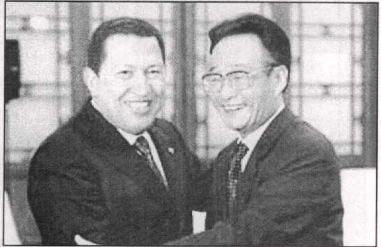
شافيز يكرم قادة الجيش الفيتنامي