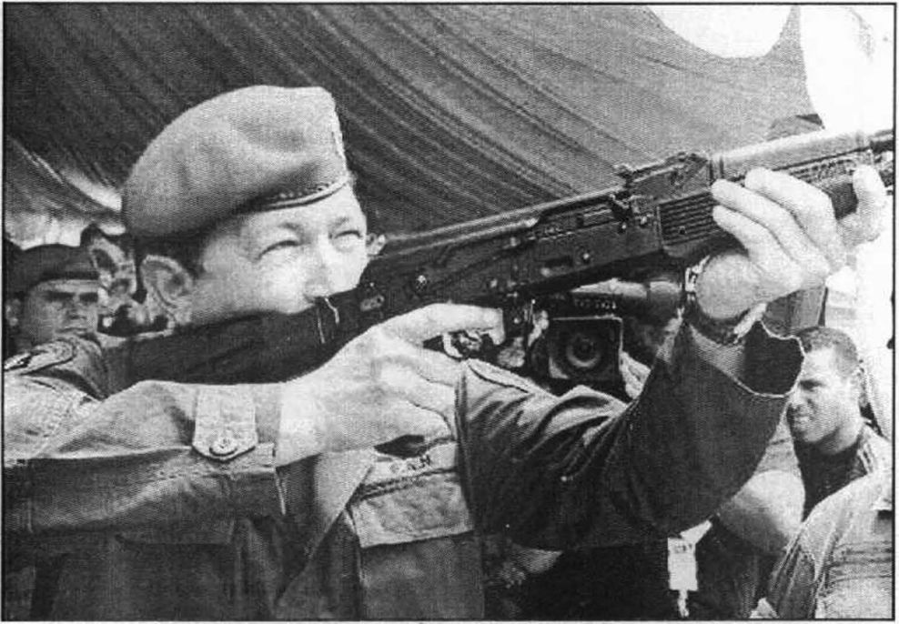
أهداف سياسية عديدة لا يتوانى شافيز عن إصابتها