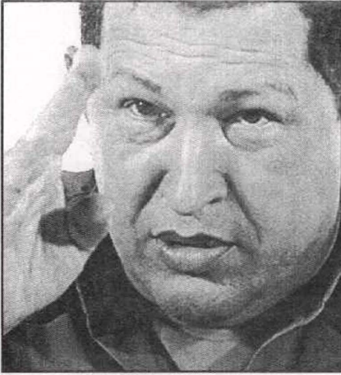
السلام.. تحية شافيز المعتادة