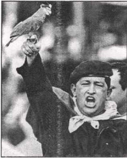
ويطلق صقرا الحرية في أميركا اللاتينية