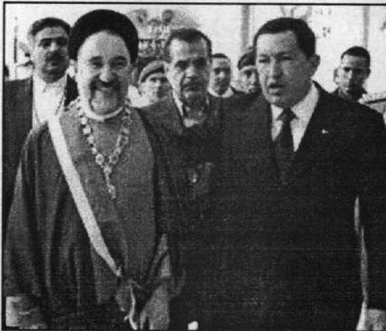
شافيز يقبل الرئيس الإيراني السابق محمد خاتمي أرفع الأوسمة الفنزويلية