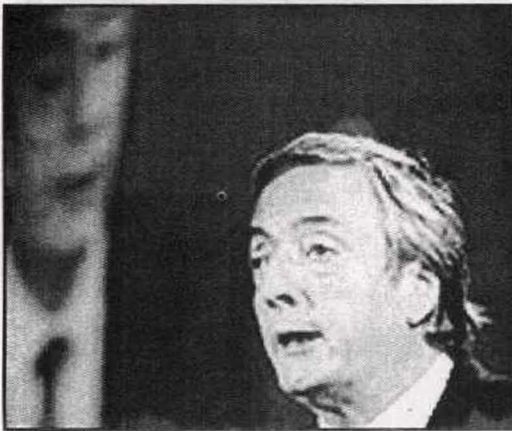
الرئيس الأرجنتيني نستور كيرشنر أسقط الحسابات الأميركية