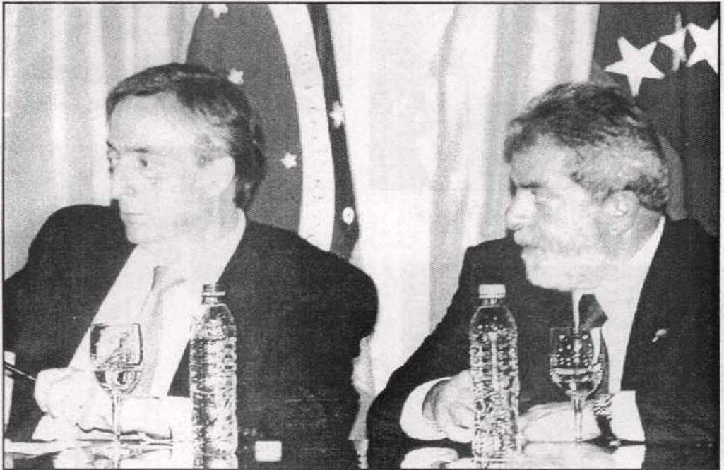
الرئيس البرازيلي والأرجنتيني يكملان عقد التحالف المناهض للإمبريالية