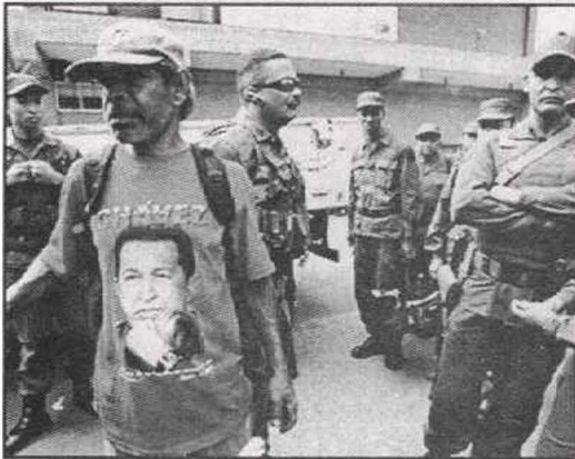
أحد مناصري شافيز القراء ولسان حاله يقول: مع شافيز حتى النهاية