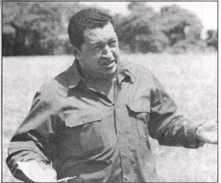
يرفض أي مساومة على مواقفه الوطنية