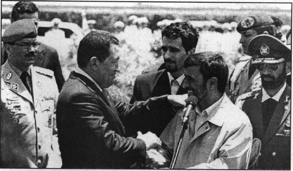
لقاءات ومحادثات دائمة بين الرئيس الإيراني نجاد وشافيز من أجل بناء تحالف قوي ضد الإمبريالية الأميركية