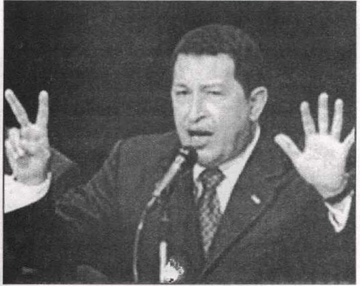
شافيز يصرح سياساته في أحد المؤتمرات