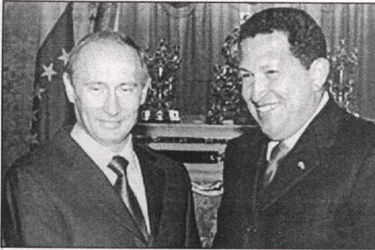
الرئيس الروسي بوتين في حوار دائم مع شافيز من أجل إعادة بناء جبهة مناهضة للإمبريالية الأميركية