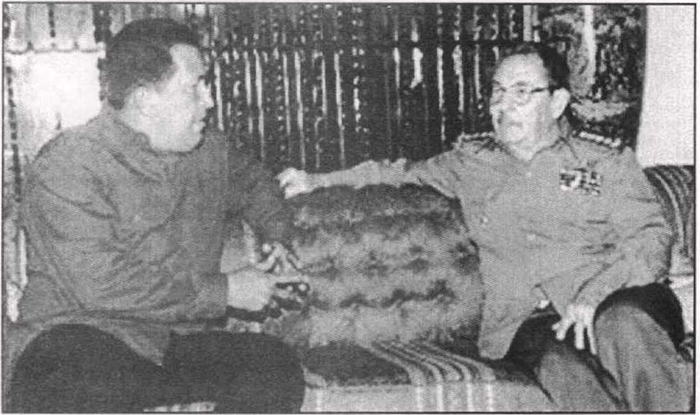
راؤول كاسترو زعيم كوبا المنتظر في محادثات مع شافيز