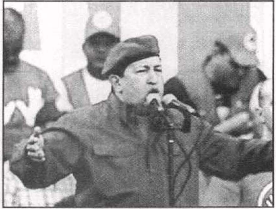
يخطب في أنصاره