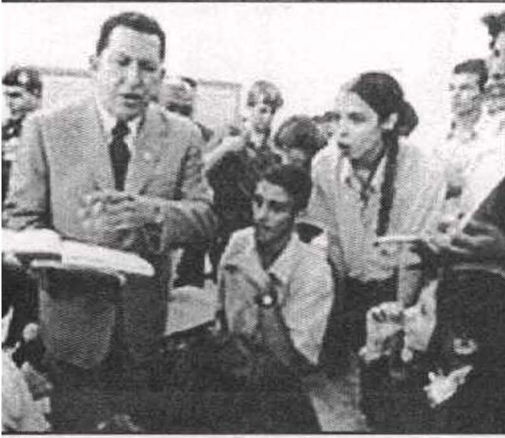
القائد في زيارة لإحدى مدارس كراكاس