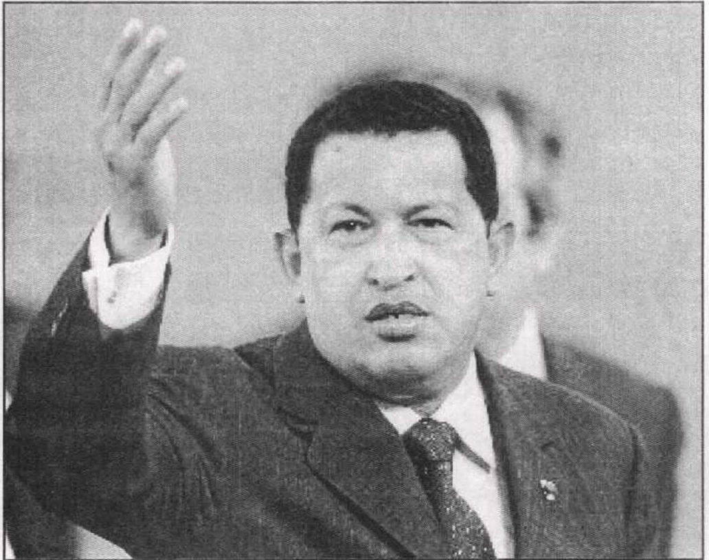
شافيز يدعو لمواصلة الثورة