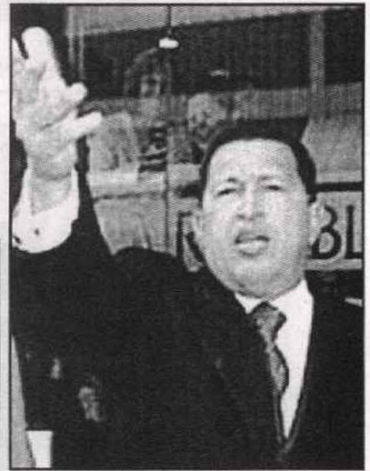
البحث عن المجهول هدف شافيز المتشود