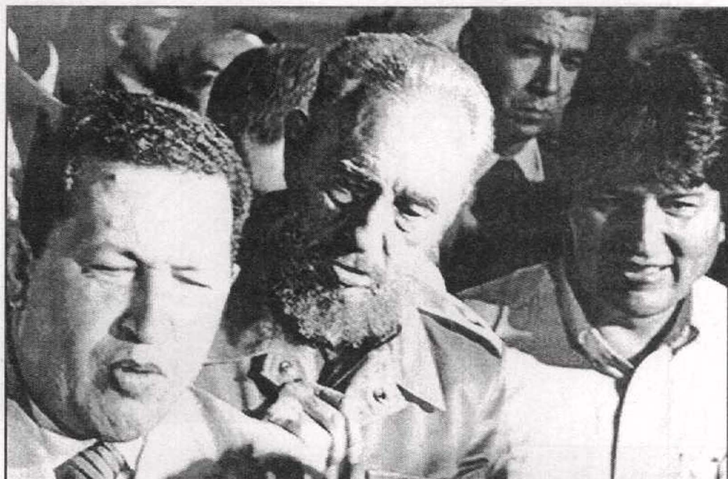
العلم (كاسترو) والتلميذ (شافين) والرفيق (مورايس) ونظرة للمستقبل