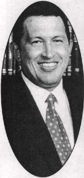
الأيام الأولى للرئاسة