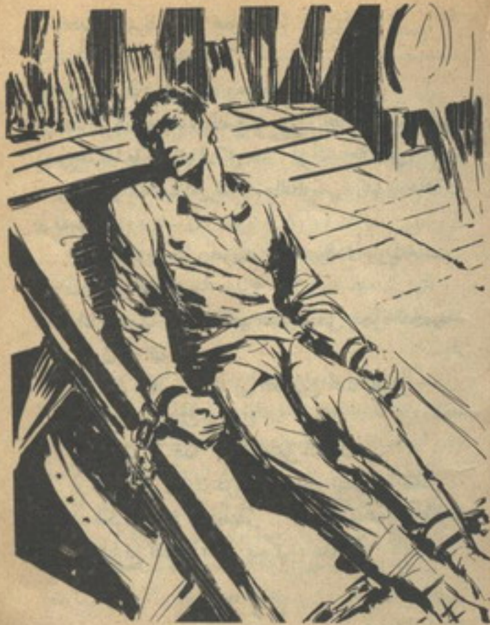
وحاول للمرة الألف أن يتخلص من قيوده الفولاذية ، وأحس أنه لم يجد وسيلة واحدة ..

وعاد المؤثر ينخفض إلى عشر درجات تحت الصفر ، وبدأ جسد ( أدهم ) يرتجف من البرودة القارصة ، وحاول للمرة الألف أن يتخلص من قيوده الفولاذية ، وأحس أنه لم يجد وسيلة واحدة للفرار هذه المرة .. وتذكر كل مغامراته السابقة ، ونجاته من الموت عشرات المرات فيما يشبه المعجزة ، واستعاد ذكرى علاقته بزميلته ( منى ) ، وحبها ، وتلك العاطفة القوية التي تربط بين قلبهما ، وشعر بالأسف ؛ لأنه لن يراها قبل أن يلقي مصرعه ، ثم أغلق عينيه ، واستسلم للموت في هدوء ، وهو يرسم على شفثيه ابتسامة ساخرة ، تمنى أن تبقى على وجهه بعد أن يتحول إلى كتلة من الثلج ، حتى تكون آخر ما يراه ( هنريك إدوارد ) و ( فون دريك ) ..