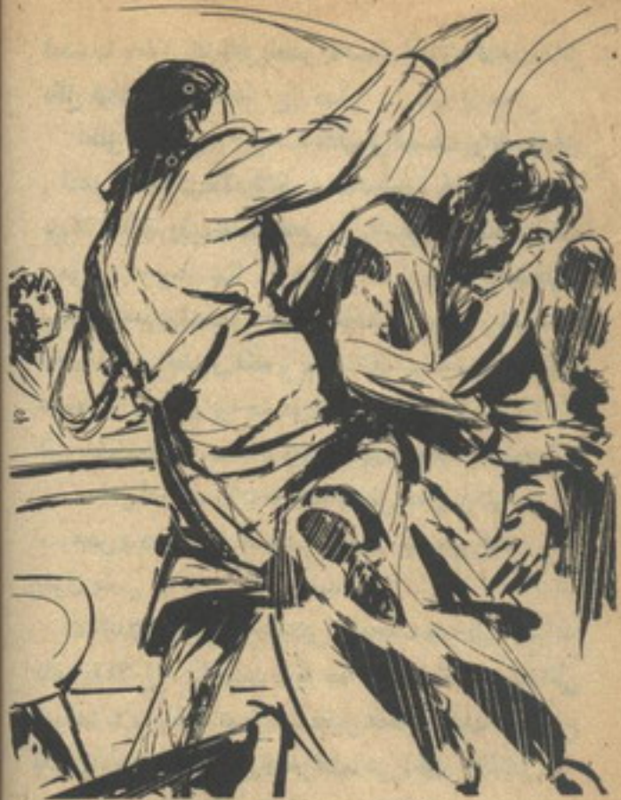
ثم تحرك فى سرعة ليفوس بركبته فى معدته ، وهوى براسته على مؤخره عنقه ..

صراعًا مستحيلًا .. ولكن ( أدهم ) أدرك فجأة أنه لا يملك الخيار .. إن قراره لا ينبغى أن يمس أبدًا أمن ( مصر ) ، مهما كان الثمن ..