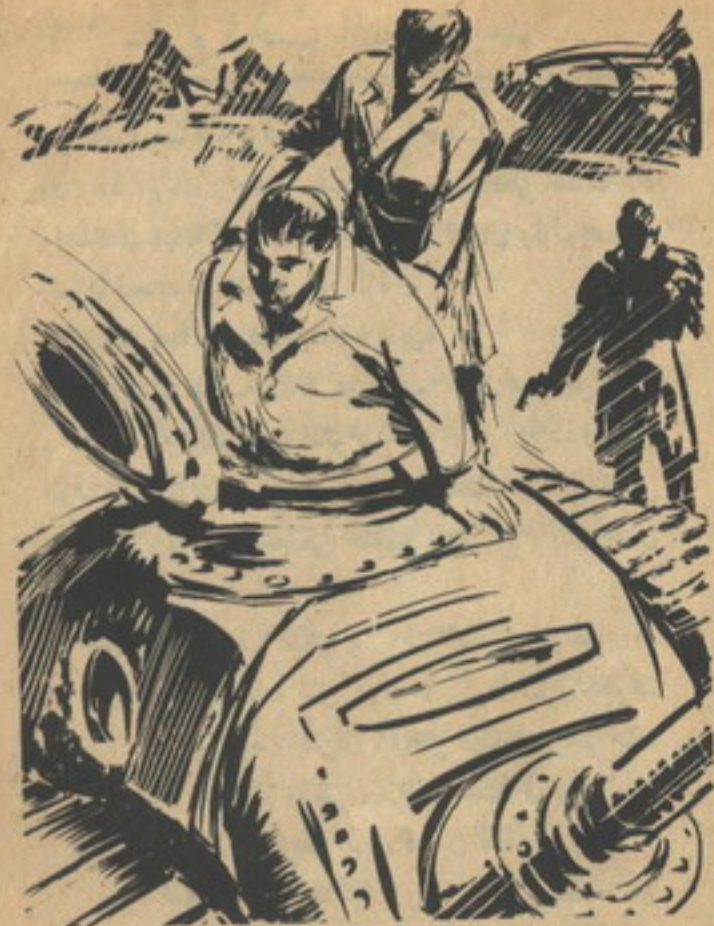
حشر ( قدرى ) جسده الضخم فى فتحة الدبابة ، وحاول ( أدهم ) معاونته ..

ضحك ( أدهم ) ، وهو يقول : — حاول يا صديقى ، وأعدك بأن أدفعك بكل ما أملك من قوة .