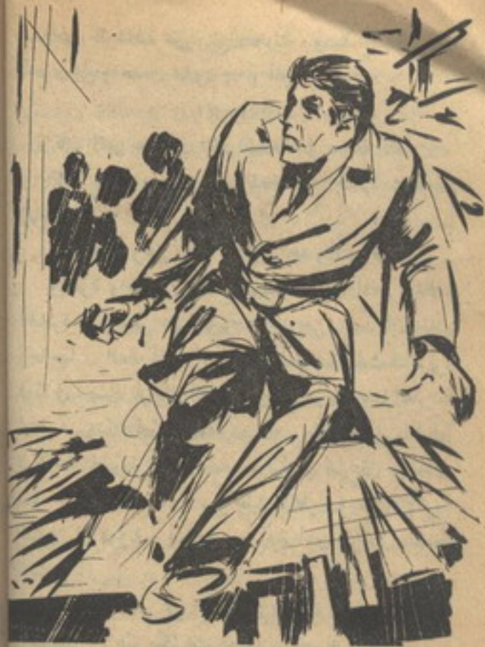
وبقفزة واحدة بارعة رشيقة ، غيرَ ( أدهم ) نافذة الحجر ، واستقرَّ على إغريزها الخارجى ..

لذا فقد أطلق ( أدهم ) النار بلا تردُّد ، وحصد الرجال السبعة بلا رحمة ، وقد قرَّر أن يريق نهرًا من الدماء إذا ما لزم الأمر ؛ يمنع ذلك المجنون من المضيُّ فُدْمًا في لحظته الشيطانية .. والتقط ( أدهم ) ثلاثة مدافع رشاشة ، أمام عيني ( هنريك ) ، الذى يراقبه غيرَ شاشات الرصد والمراقبة ، وعلق اثنين منهما في كتفيه ، وأمسك بالثالث في يسراه ، دون أن يتخلَّى عن المدفع الأوَّل ، الذى يمسكه بيمنه ، متجاهلاً صراخ ( هنريك ) الساخط ، وهو يهتف في ثورة وجنون :