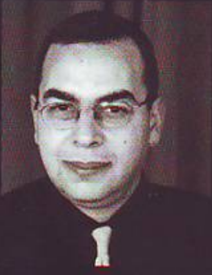
د. أحمد خالد توفيق