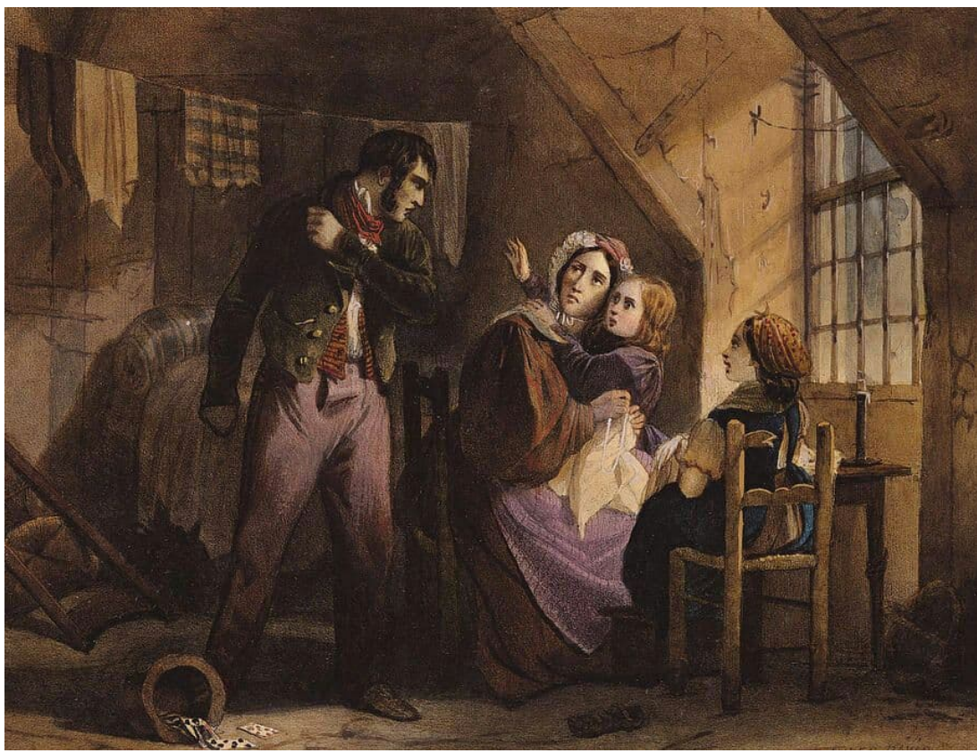
اسم الرسام: Jules David