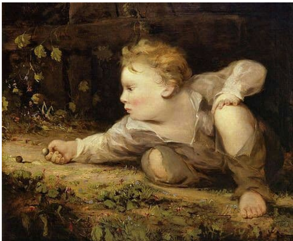
اسم الفنان: David Gilmour