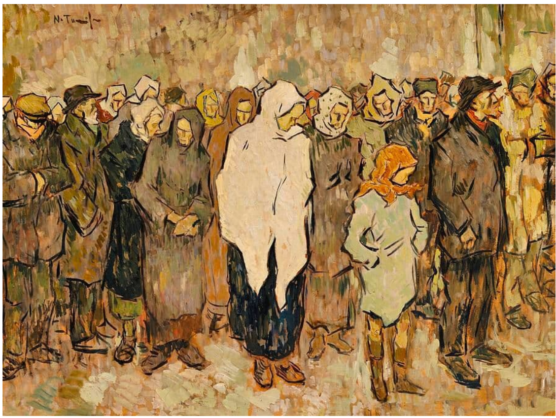
اسم اللوحة: Bread Line - Nicolae Tonitza