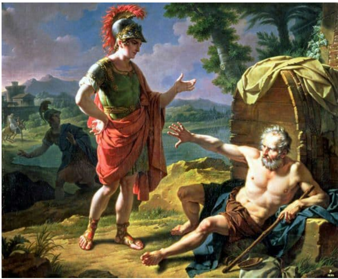
Monsiau- Alexandre et Diogene: اسم اللوحة