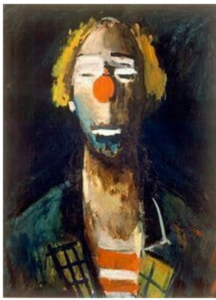
اسم الفنان: Joseph Kutter