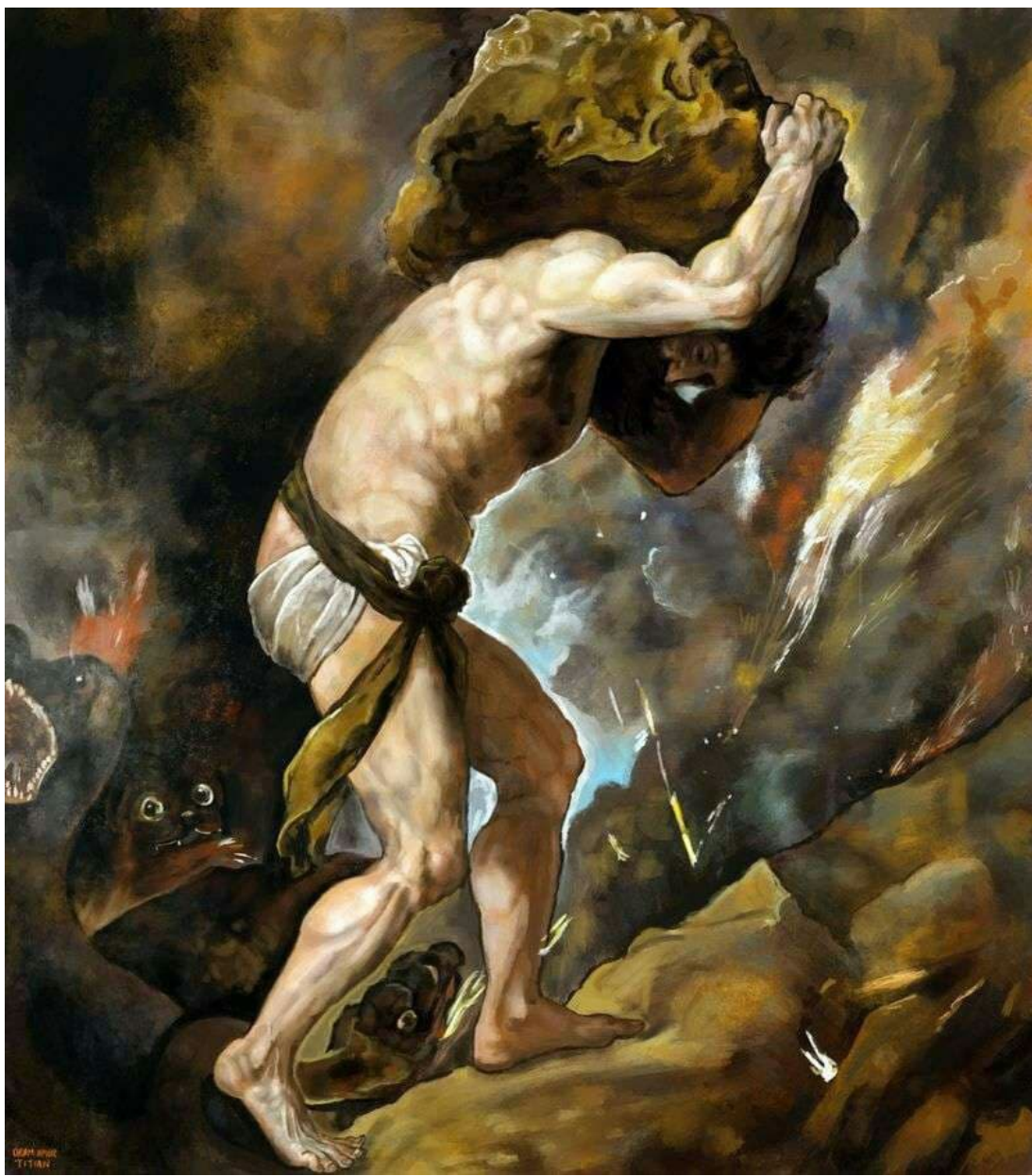
اسم اللوحة: Sisyphus Painting by Titian