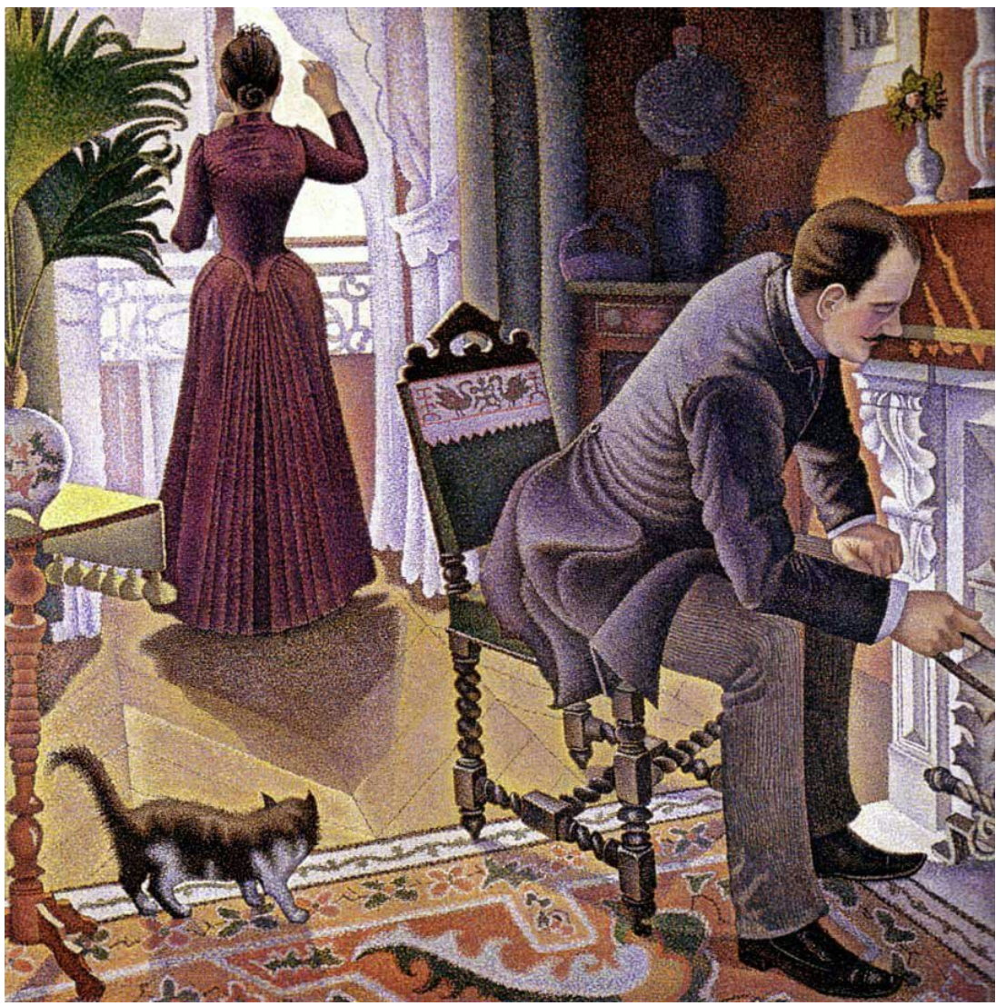
اسم اللوحة: Dimanche - Paul Signac