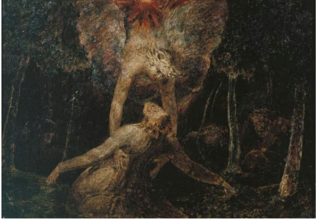
The Agony in the garden - William Blake: اسم اللوحة: