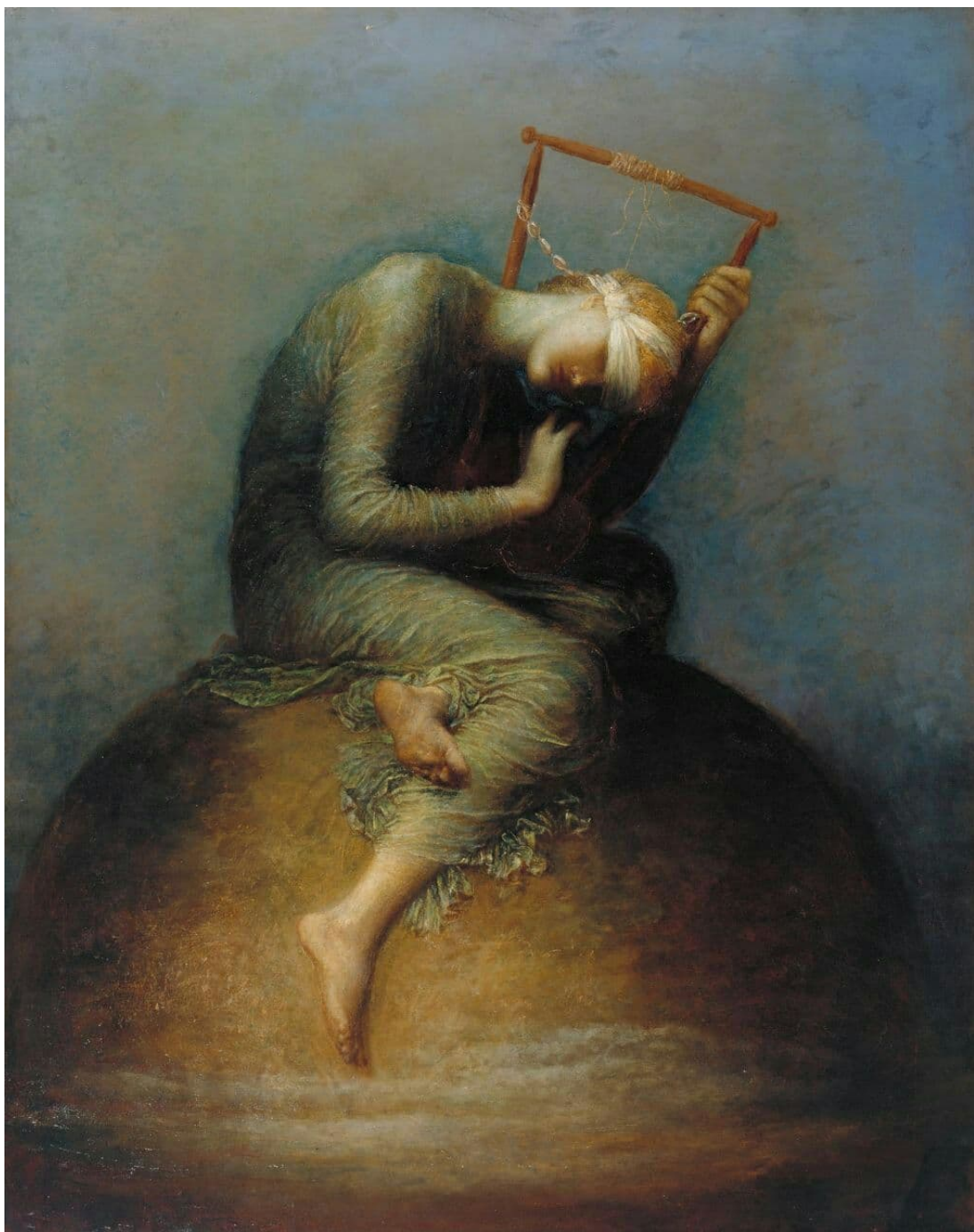
اسم اللوحة: George Frederic Watts