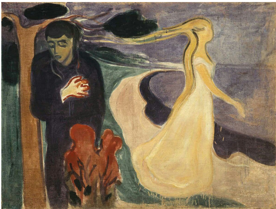
اسم اللوحة: Separation - Edvard Munch